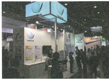
■タウンズの出展(診断薬エリア)

今後も新たなエリアへの出展や、新製品の国際機関の認証取得を視野に事業を企画・推進していく予定だ。