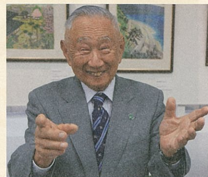
(一財)ふじのくに医療城下町推進機構 理事長