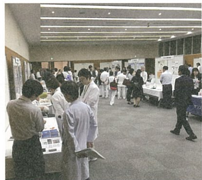
■静岡がんセンター内の院内展示会の様子

臨床現場と地域企業との連携をサポートすることもファルマバレーセンターの大きな役割のひとつであり、本展示会のほか、ファルマバレーセンター入居企業に対する静岡がんセンターの院内見学会を行うなど、一層の連携強化を進めている。