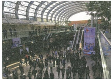
■MEDICA2017(独・デュッセルドルフ)