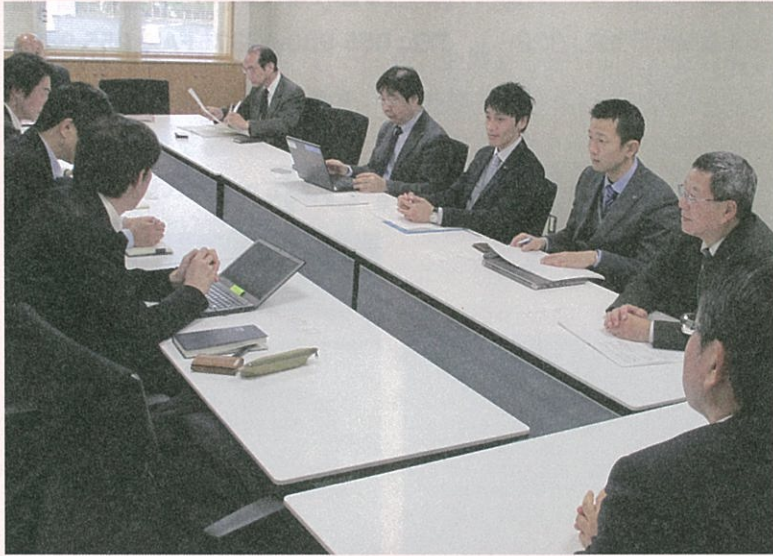
■ファルマバレーセンターと入居企業2社の打合せ