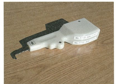
■開発された歯周ポケット測定器の試作品

平成30年度中の商品化を目指しており、同じく入居しているヤザキ工業株式会社から部材提供を受ける予定だ。昨年12月には第二種医療機器製造販売業許可を取得。ファルマバレーセンターの支援を活用して医療健康産業への足掛かりを築いている。