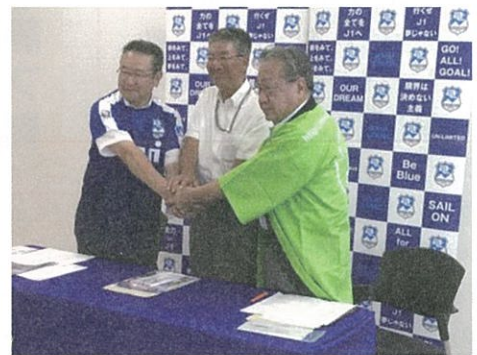
■共同記者発表で挨拶する関係者