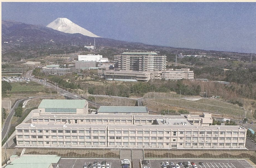
■ (一財)ふじのくに医療城下町推進機構の活動拠点 「ファルマバレーセンター(静岡県医療健康産業研究開発センター)」