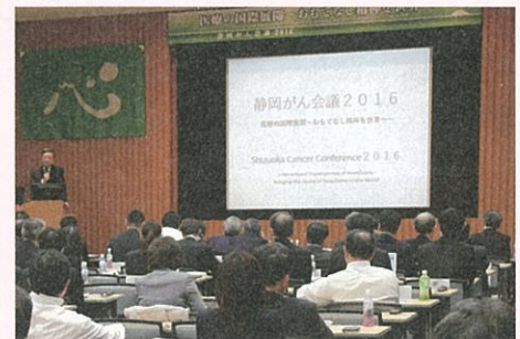
■昨年度の開催風景

遺伝子研究、患者家族支援体制などの静岡がんセンターが積み重ねてきた実績や現状、さらには地域の医療・健康産業活性化を目指すファルマバレーセンターの成果や今後について紹介し、新たな時代の「理想のがん医療」につなげていくことを目的に開催する。